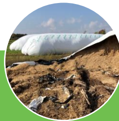
Sacs silos pour ensilage