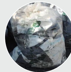
Bâches et sacs silos pour ensilage