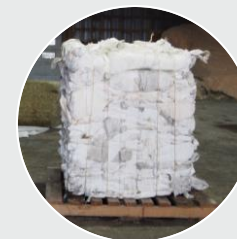
Pellicules de plastique pour balles d'ensilage